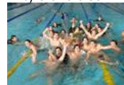
raccolta - invia fot

Campionato Serie A CC ANIENE Campione d'Italia 2009