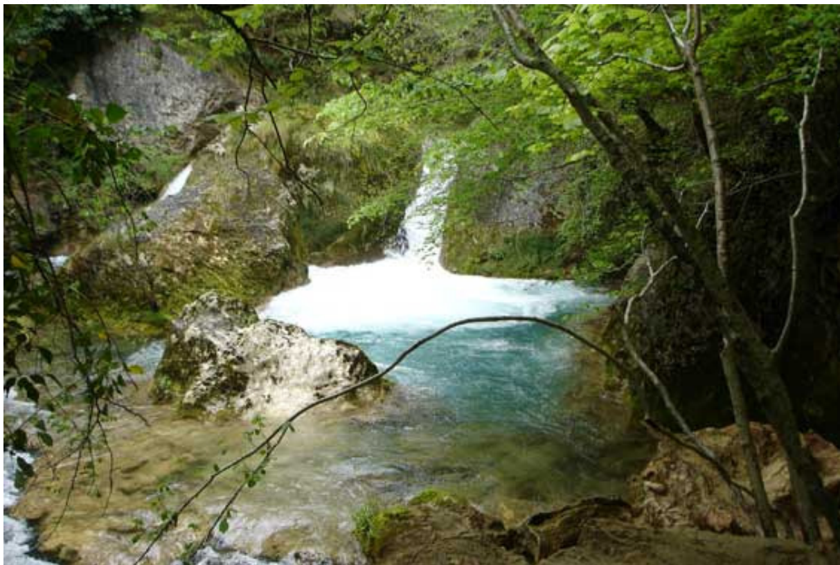
EXCURSIÓN: Nacedero del Río UREDERRA

Plaza Monasterios de Navarra, 9 bajo Teléfono 948 19 65 35 E-mail: losamigosdelarte@yahoo.es 31011 PAMPLONA