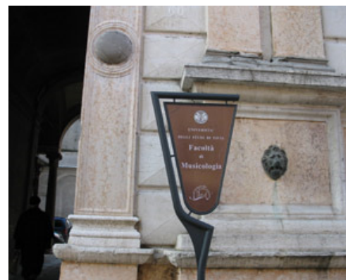
Palazzo Raimondi, sede di Musicologia