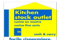
Kitchen Stock Outlet