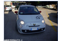
Fiat 500 Abarth 1400 Tjet 135cv